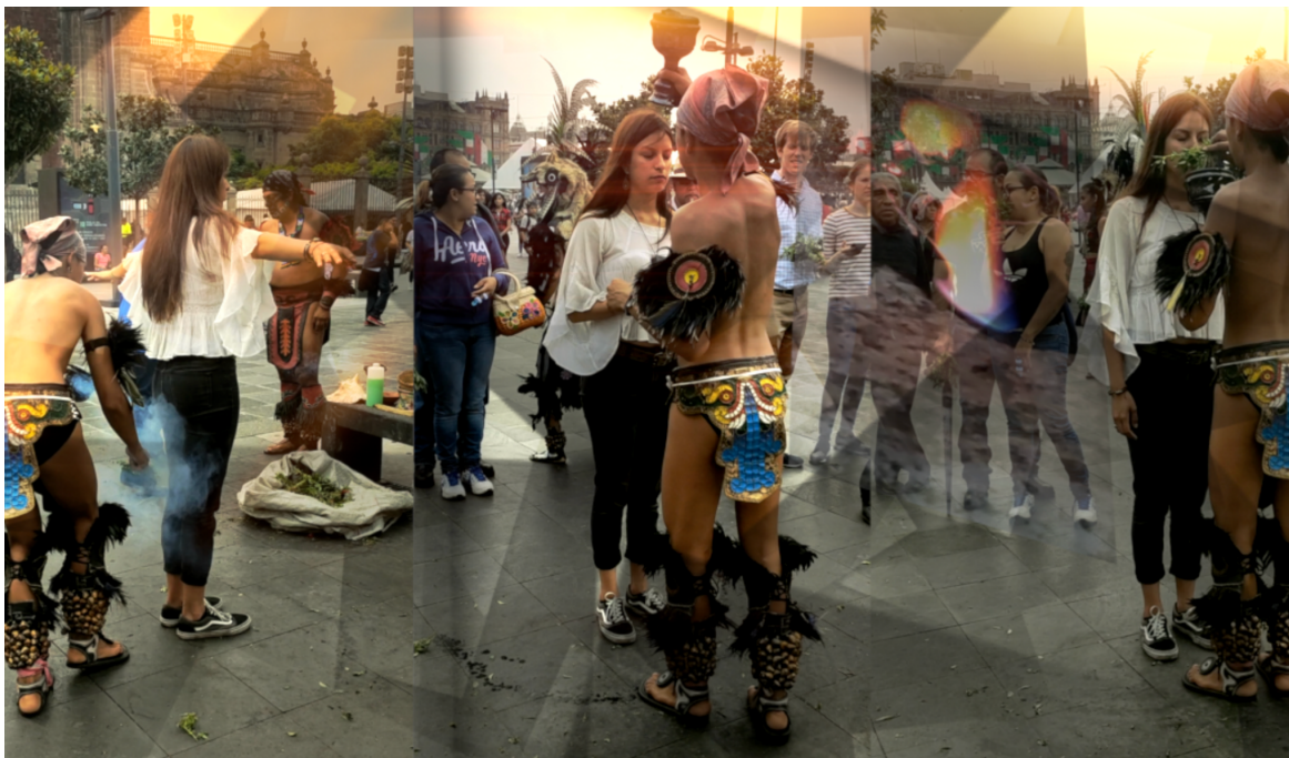
Stills del cortometraje, Muerte al Mal de Ojo, 2019,

Muerte al Mal de Ojo , cortometraje documental experimental, 13min., 2019, fue grabado en diferentes lugares de México, mostrando la práctica de 'limpias mexicanas', una técnica que se cree ser de curación física y espiritual, que resulta de la mezcla de prácticas indígenas tradicionales, espirituales y medicinales, con rituales católicos y aztecas. Los practicantes suelen utilizar elementos como huevos, limones, hierbas y otros objetos, usados para 'absorber' la energía negativa/enfermedad de la persona que está siendo curada. Los objetos a menudo se queman o se tiran después. El video se proyectó en la Galería Arosita, en Sofía, Bulgaria.