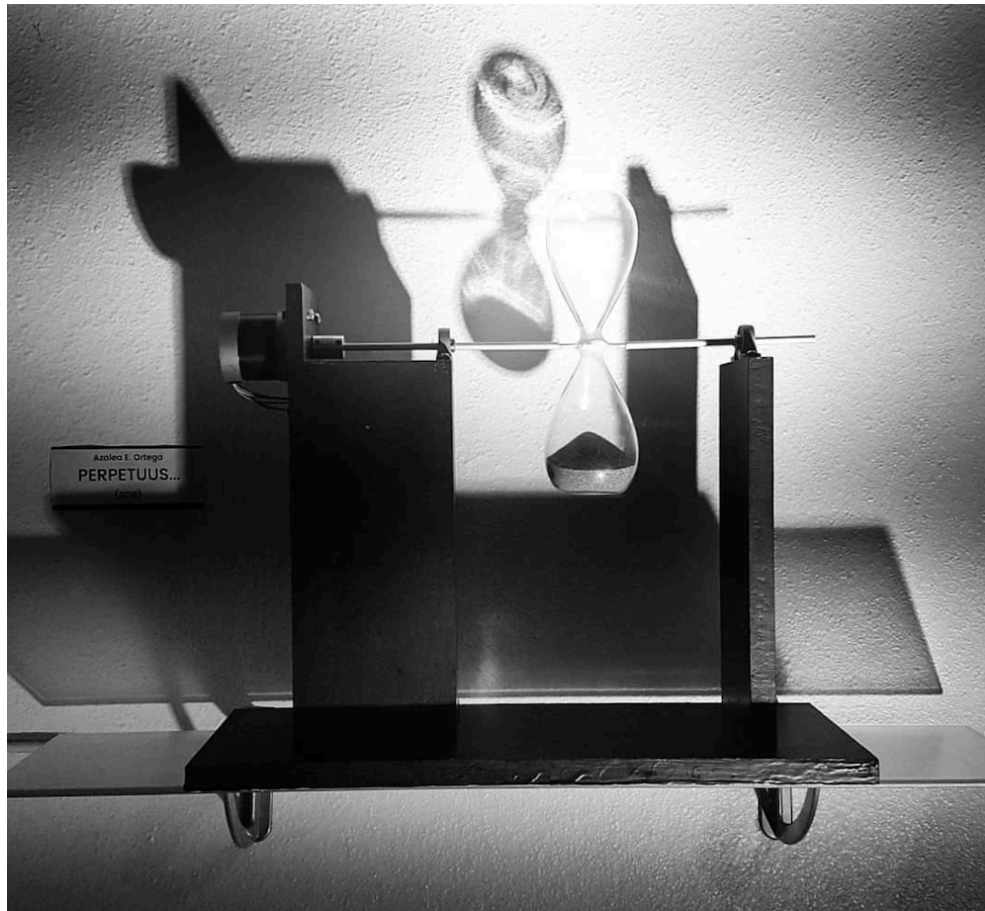
Perpetuus, Escultura Interactiva, 2018, SOHO en Ottakring, Viena.

Perpetuus , 2018, es una instalación interactiva donde un reloj de arena suspendido gira sin cesar. Los espectadores pueden detener la rotación del reloj de arena si se relajan con el uso de un auricular Brainwave, un dispositivo portátil para registrar la actividad eléctrica del cerebro. El auricular se programó para permitir a los usuarios detener o iniciar la rotación del reloj de arena relajándose/enfocándose, según la tarea deseada. Se mostró en SOHO en Ottakring, Viena, Austria.