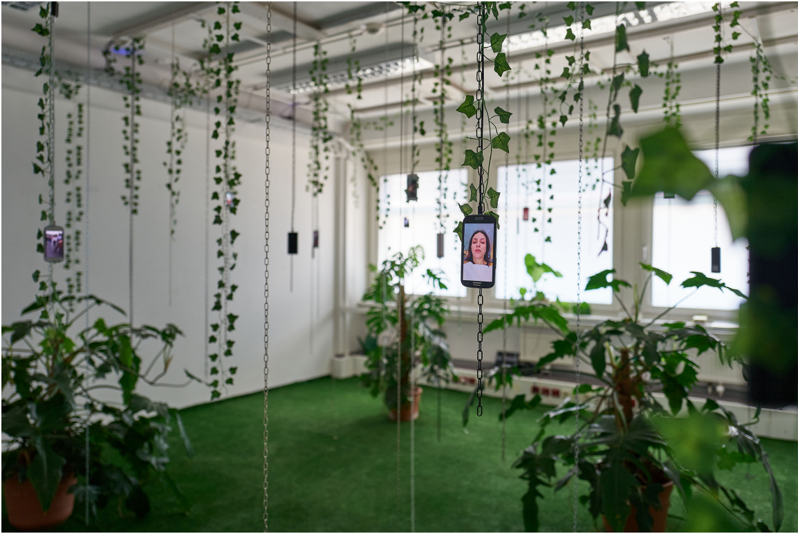
Dis (whole) ease, 2022.

HETEROTOPIA , 2016, instalación interactiva que conecta un sanatorio abandonado en una playa abandonada en Tampico, México, con un sanatorio en Sokolowsko, Polonia, donde se llevó a cabo la exposición.