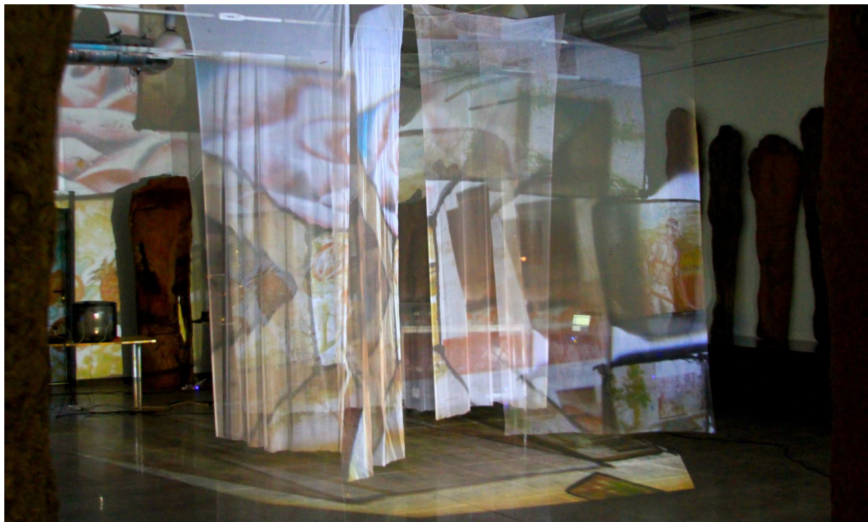
Heterotopia, 2016, Sokolowsko. Poland.